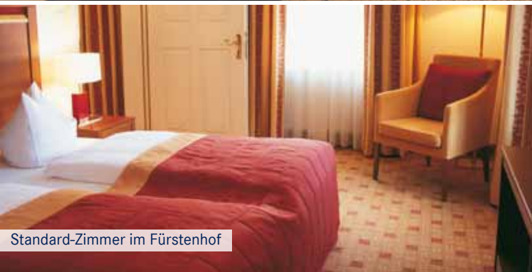
Standard-Zimmer im Fürstenhof