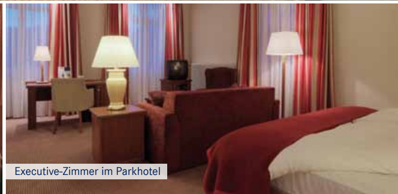
Executive-Zimmer im Parkhotel