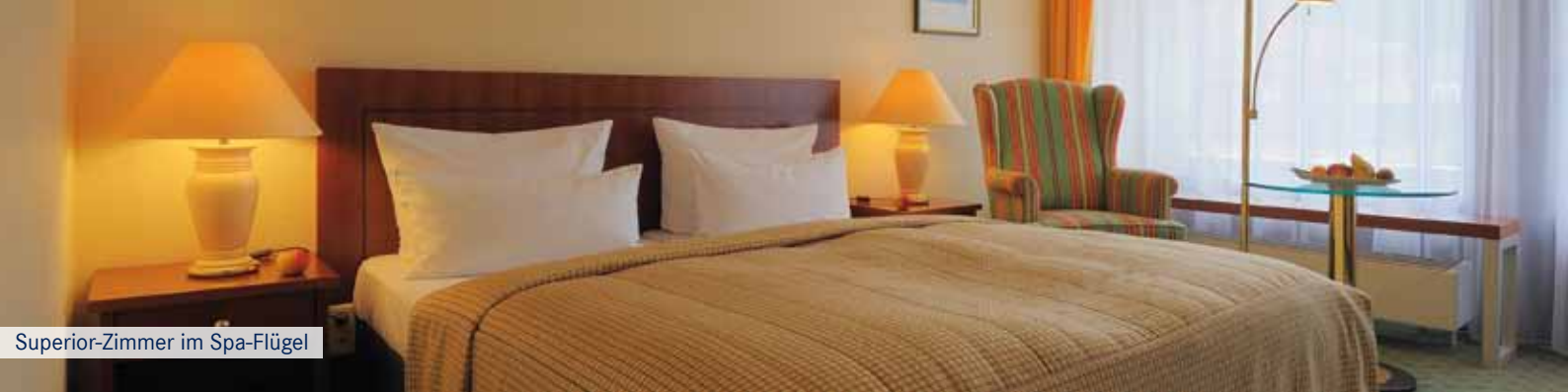
Superior-Zimmer im Spa-Flügel